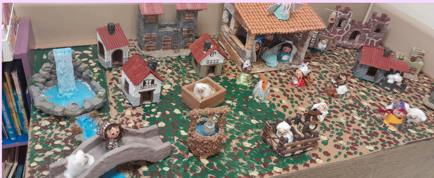
Imagen del Belén elaborado por los pacientes del Centro de Terapia Ocupacional