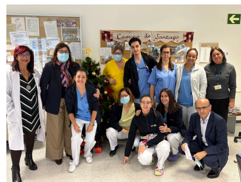
Hospital de Día