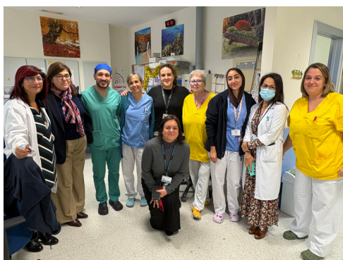
Adaptación al Medio