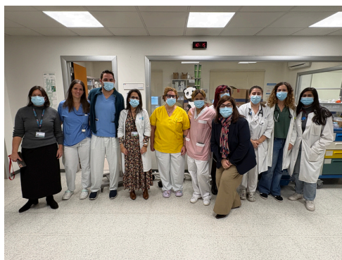
Hosp. B 2