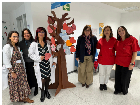
Banco de Sangre