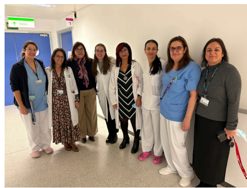
Cirugía y Anestesia