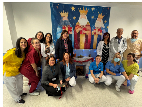
Hosp. C 2