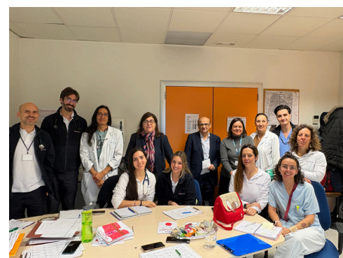
Ud. Enlace y H. Domicilio