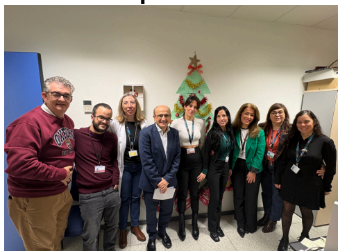
Att. al Paciente