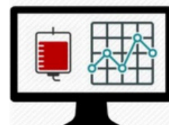
HemoCod Suite Sistema de control

El objetivo principal de este proyecto es digitalizar el proceso de obtención de muestras y administración de componentes sanguíneos junto a la cabecera del paciente , mejorando así la trazabilidad y reduciendo los riesgos en los puntos críticos de la cadena transfusional.