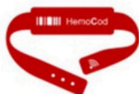
HemoCod Banda Pulsera de seguridad