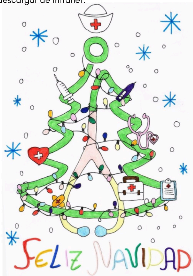
Imagen ganadora del I Concurso de Felicitación Navideña del HUIC Autor: VÍCTOR TORREJÓN MARTÍ 11 años

De acuerdo a las bases del Concurso, el Gabinete de Prensa y Comunicación ha elaborado la felicitación navideña corporativa del Hospital Universitario Infanta Cristina a partir de la imagen ganadora, que podéis descargar de Intranet.