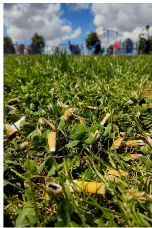
2 PREMIO: Sofía Portillo Romero 3 ESO B