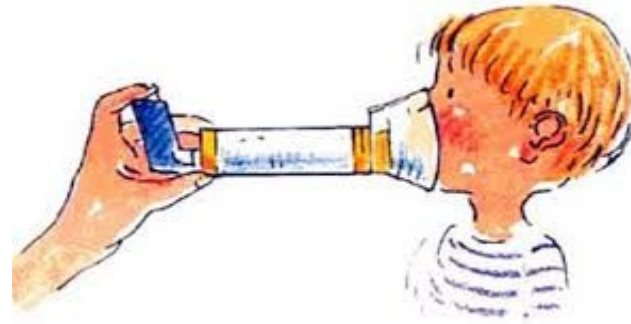
Figura 2. Inhalación con mascarilla. Posición en L