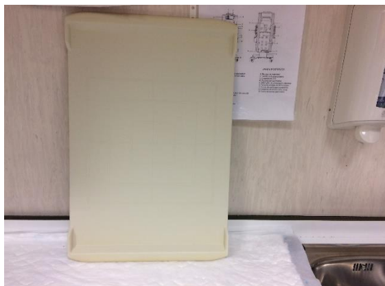
Bandeja de RX